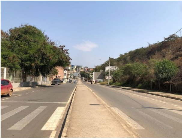
Figura 1 - Avenida Antônio Augusto de Oliveira.