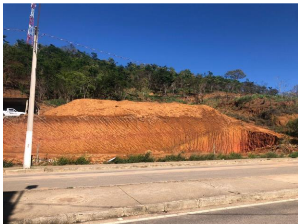
Figura 5 – Bem avaliando.