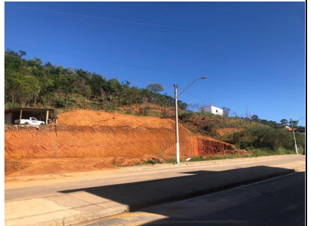
Figura 4 - Bem avaliando.