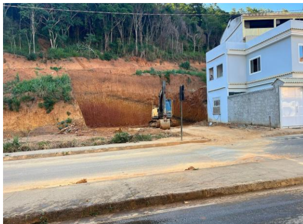
Figura 7 – Bem avaliando.