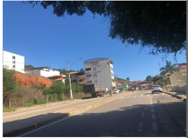
Figura 2 - Avenida Antônio Augusto de Oliveira.