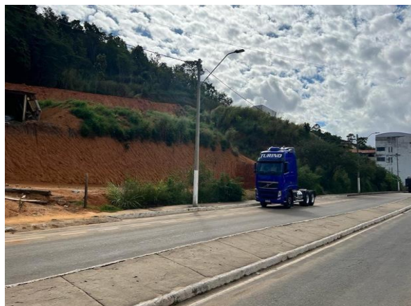
Figura 6 – Bem avaliando.