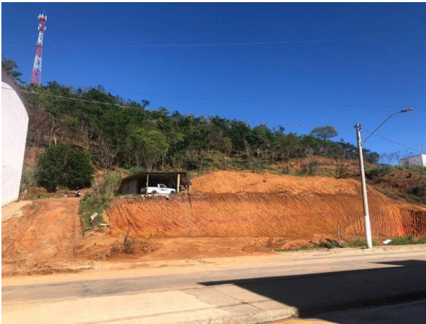
Figura 3 - Bem avaliando.