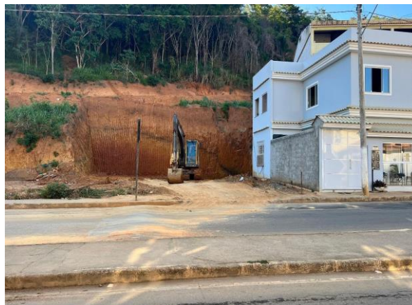
Figura 8 – Bem avaliando.